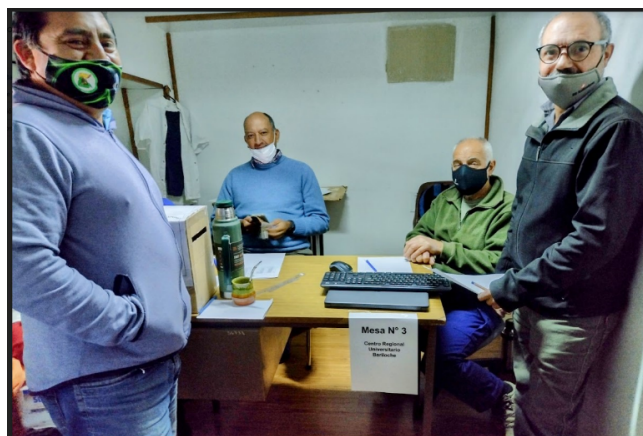
Imagen 1. Mesa de Bariloche